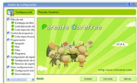
Fig. 2. : Centro de Configuración